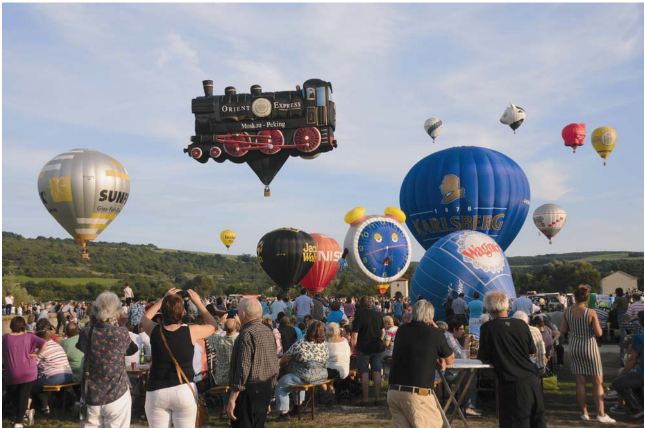
Massenstart der Heißluftballons im Europäischen Kulturpark Reinheim.

4. Heißluftballon- und Drachenfestival in Reinheim • samstags Ballonglühen